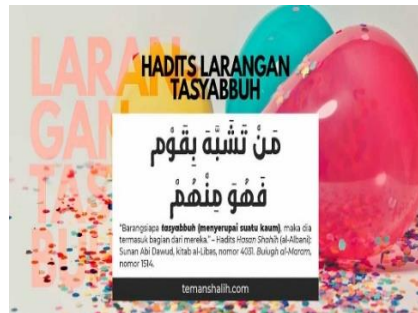
Gambar X: Larangan Tashabbuh.