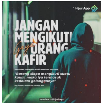
Gambar III : “Stop menyerupai orang kafir”. @bimbingan_islam, termuat juga dalam pinterest.com)