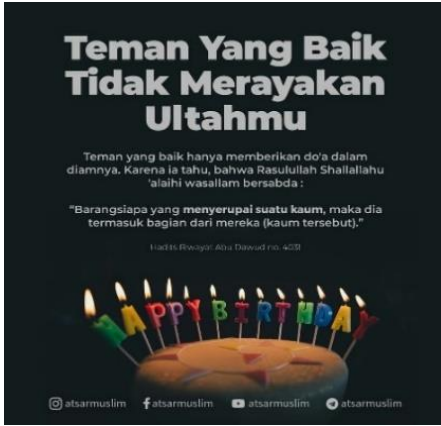
Gambar XI: Teman yang baik tidak merayakan ultahmu, teman yang baik hanya memberikan doa dalam diamnya... (@atsarmuslim, termuat juga dalam ummah.id)