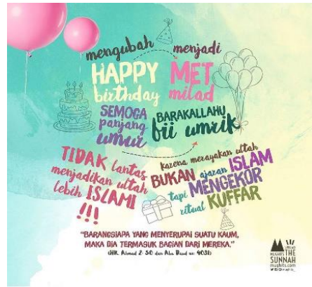
Gambar XIII: Mengubah happy brithday, semoga panjang umur menjadi met milad, barakallah fii umrik tidak lantas menjadi ultah lebih Islami !!! (akun facebook Mughist).

Lima gambar di atas secara umum membicarakan tentang larangan tashabbuh dalam konteks perayaan hari ulang tahun dengan pemaknaan universal. Dari ke lima gambar tersebut, masing-masing juga memuat keterangan dan ilustrasi gambar yang berbeda-beda. Pada gambar (IX) terdapat sebuah keterangan, “ Jangan latah...!!! ” dengan ilustrasi gambar kue dan lilin yang diklaim sebagai tashabbuh yang terlarang dalam pandangan hadis Nabi. Gambar ke (X) memuat keterangan “ Larangan tashabbuh ”, dengan ilustrasi gambar balon sebagai simbol yang juga diklaim sebagai bagian dari tashabbuh