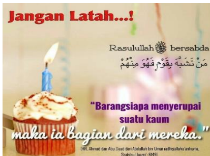
Gambar IX: Jangan latah...! (sofyanrurary.info, termuat juga dalam, taawundakwah.com).