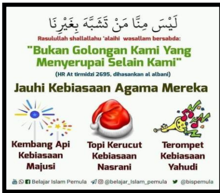
Gambar VII: Jauhi kebiasaan agama mereka, kembang api kebiasaan Majusi, topi kerucut kebiasaan Nasrani dan terompet kebiasaan Yahudi (@belajar_islam_pemula).