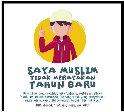
Gambar VI: Saya muslim tidak merayakan tahun baru