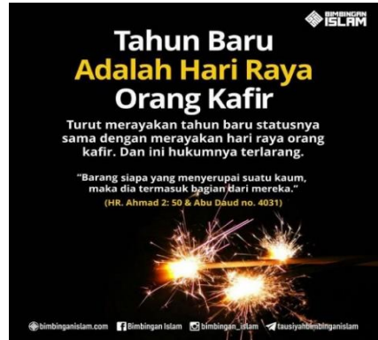
Gambar VIII: Tahun baru adalah hari raya orang kafir, turut merayakan tahun baru statusnya sama dengan merayakan hari raya orang kafir dan ini hukumnya terlarang (Facebook; Bimbingan Islam).

Empat gambar di atas secara umum membicarakan larangan tashabbuh dalam konteks perayaan tahun baru. Dari empat gambar tersebut, masing-masing memuat narasi dan ilustrasi yang berbeda-beda. Pada gambar (V) menunjukkan keterangan yang termuat dalam